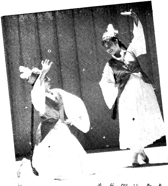
卡 馬 查 依