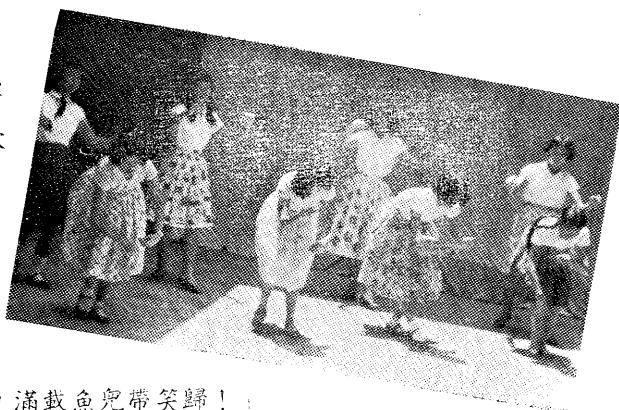
「不怕天寒風又猛，滿載魚兒帶笑歸！」