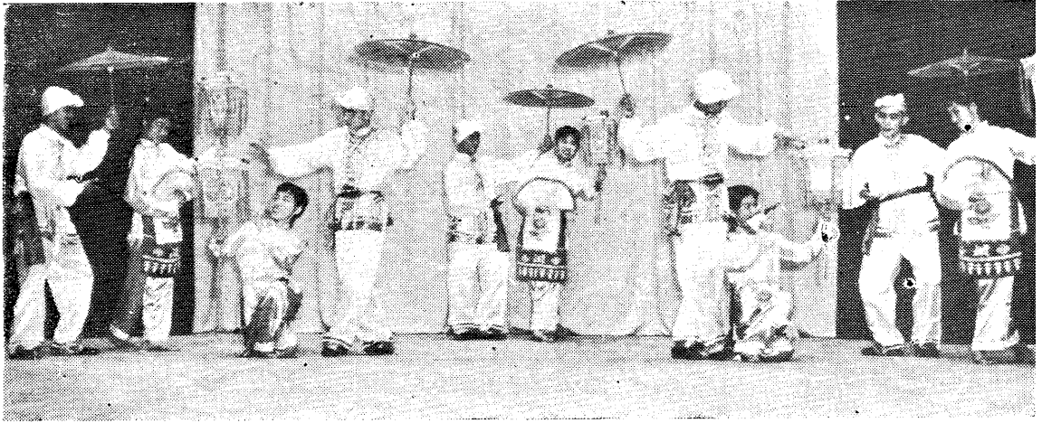
彩燈花傘 續。紛飛舞 看 燈